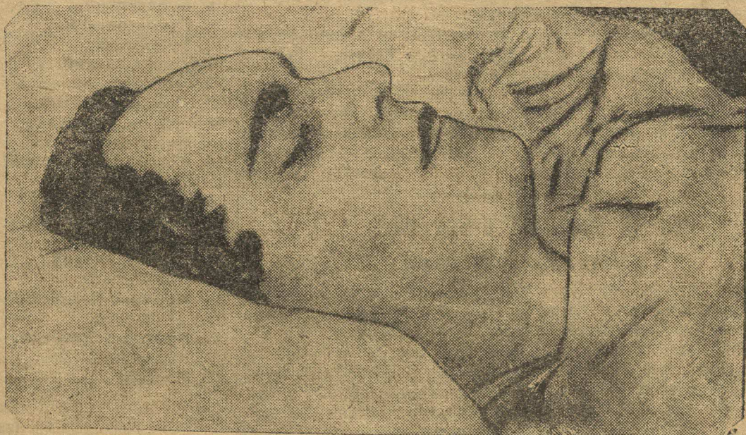
В. В. Куйбышев через два часа после смерти

Работники типографии зовут трудящихся нашего района к лучшей организации труда и развертыванию соревнования.