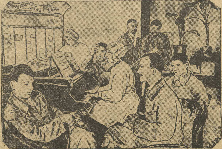
Культурные развлечения — один из методов лечения. На снимке: музыкальный кружок Ставропольской психбольницы за работой.

назад „угрожали“, других арестовывали за (как они сами в том признаются на суде) контрреволюционную деятельность, третьи что-то „слышали“ и т. д.